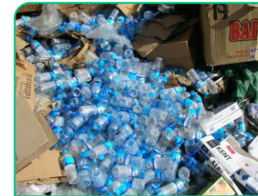
Miljøaspekter i produktstandarder