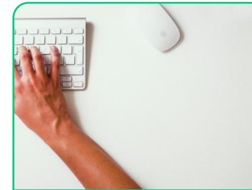
Miljørapportering og -terminologi