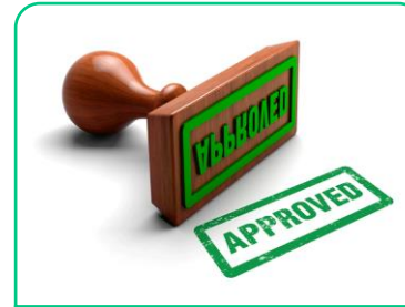
Miljømerking og miljødeklarasjoner