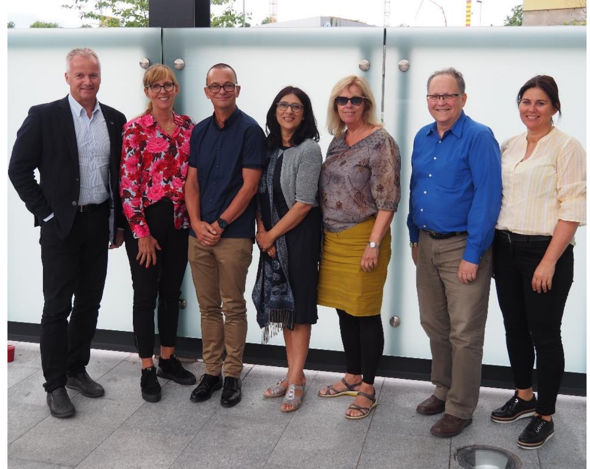
Komit  SN/K 566 Mangfoldsledelse