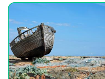
Klimagasser og (konsekvenser av) klimautvikling