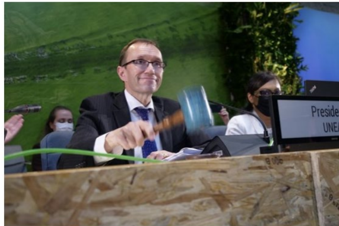
Klima- og miljøminister Espen Barth Eide leder FN's femte miljøforsamling der verdens land er blitt enige om å få på plass en internasjonal avtale mot plastforurensing.

Verdens land er enige om å få på plass en internasjonal avtale mot plastforurensing. Enigheten understreker at det haster med tiltak på tvers av hele plastens livsløp. Ambisjonen er å ferdigstille avtalen i 2024. Vedtaket markerer et historisk skille i det globale arbeidet mot plastforurensning.